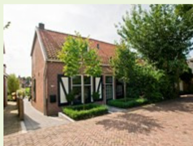
P.S. dit is ons nieuwe huisje!